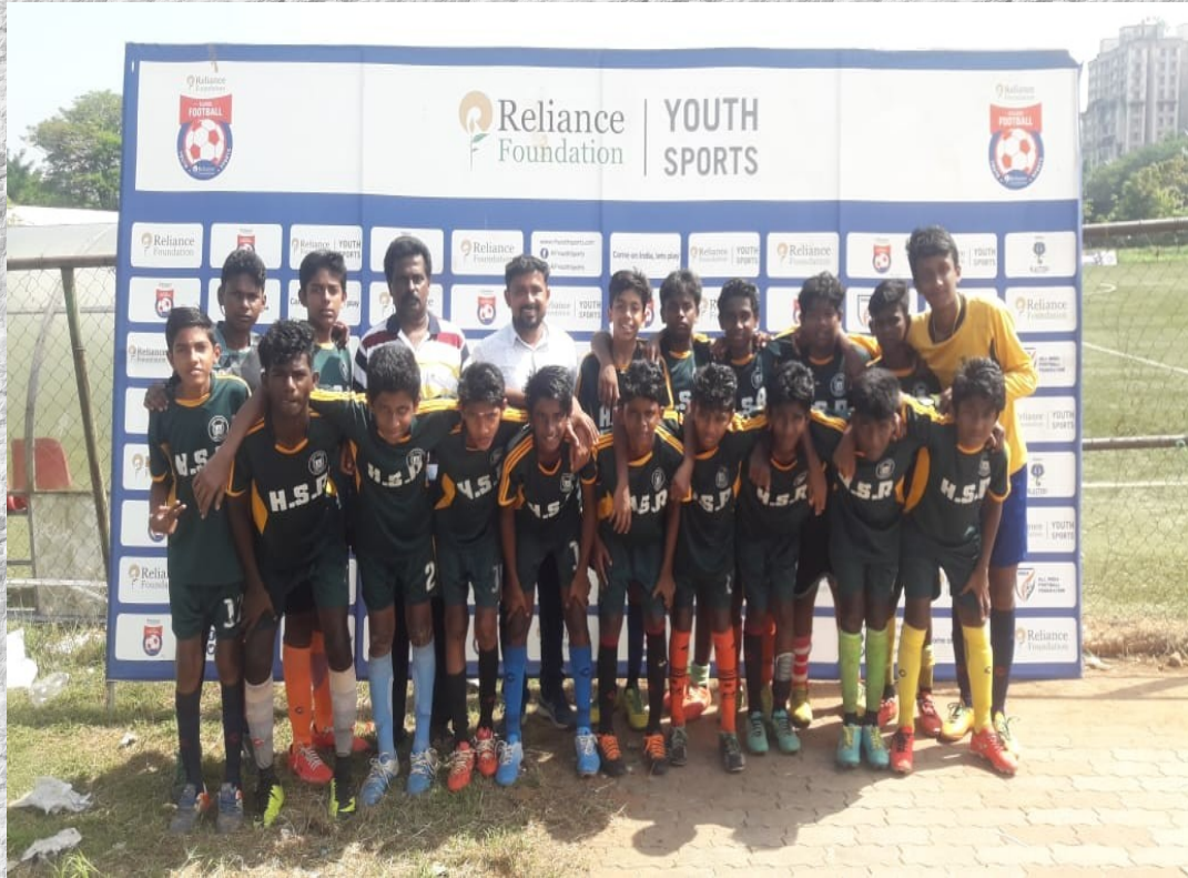
മികച്ച പ്രകടനം കാഴ്ചവച്ച ടീം