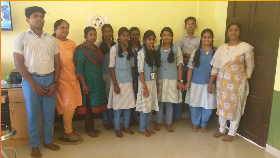
ലിറ്റിൽ കൈറ്റ്സ് എഡിറ്റോറിയൽ ബോർഡ്