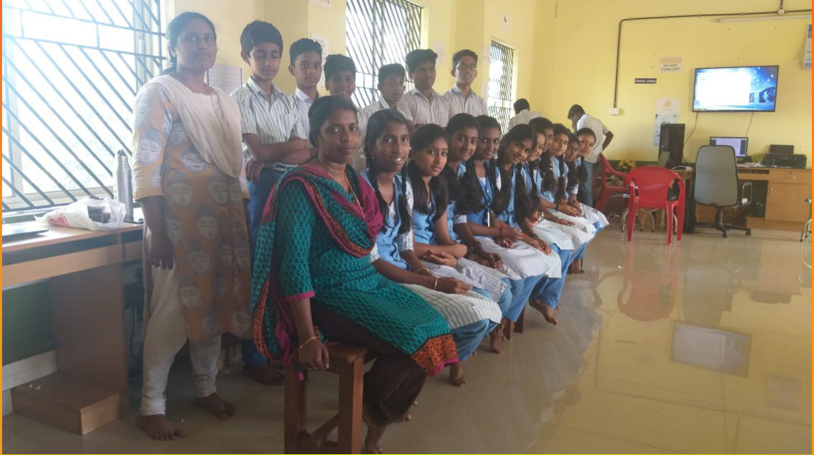
ലിറ്റിൽ കൈറ്റ്സ് അംഗങ്ങൾ