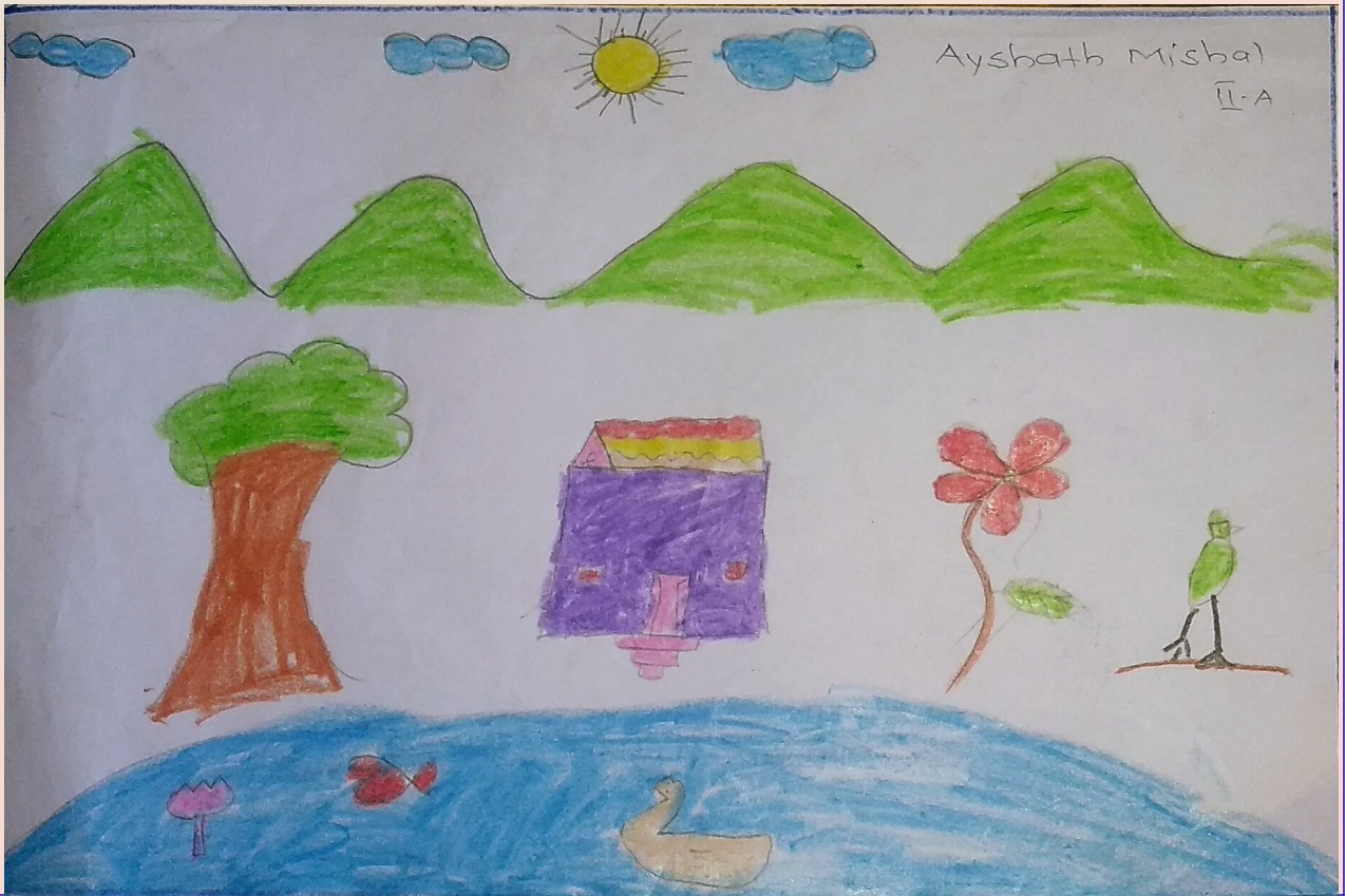
Aysbath Misbah II-A