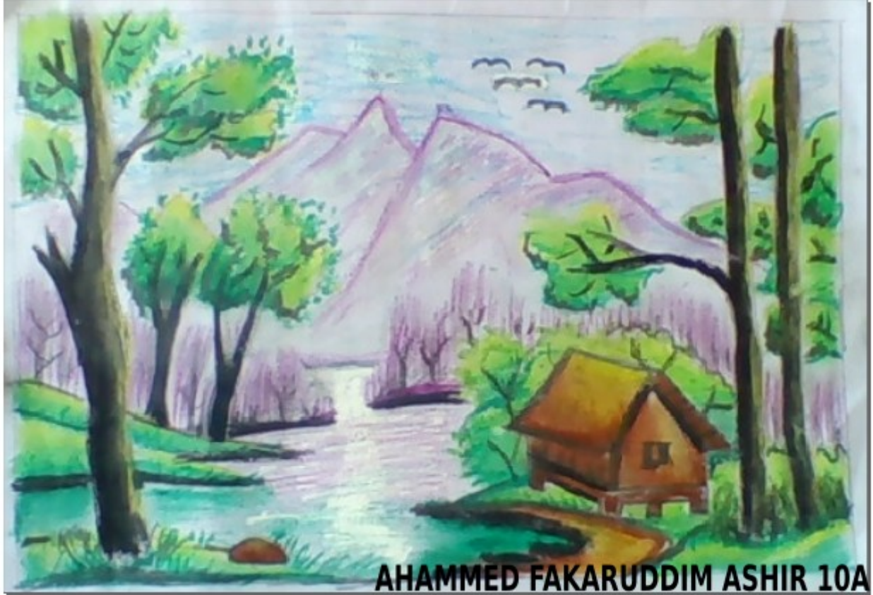
AHAMMED FAKARUDDIM ASHIR 10A