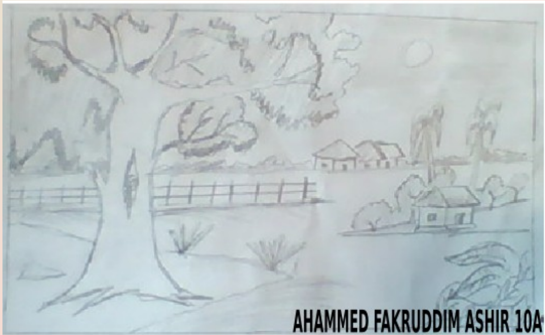
AHAMMED FAKRUDDIM ASHIR 10A