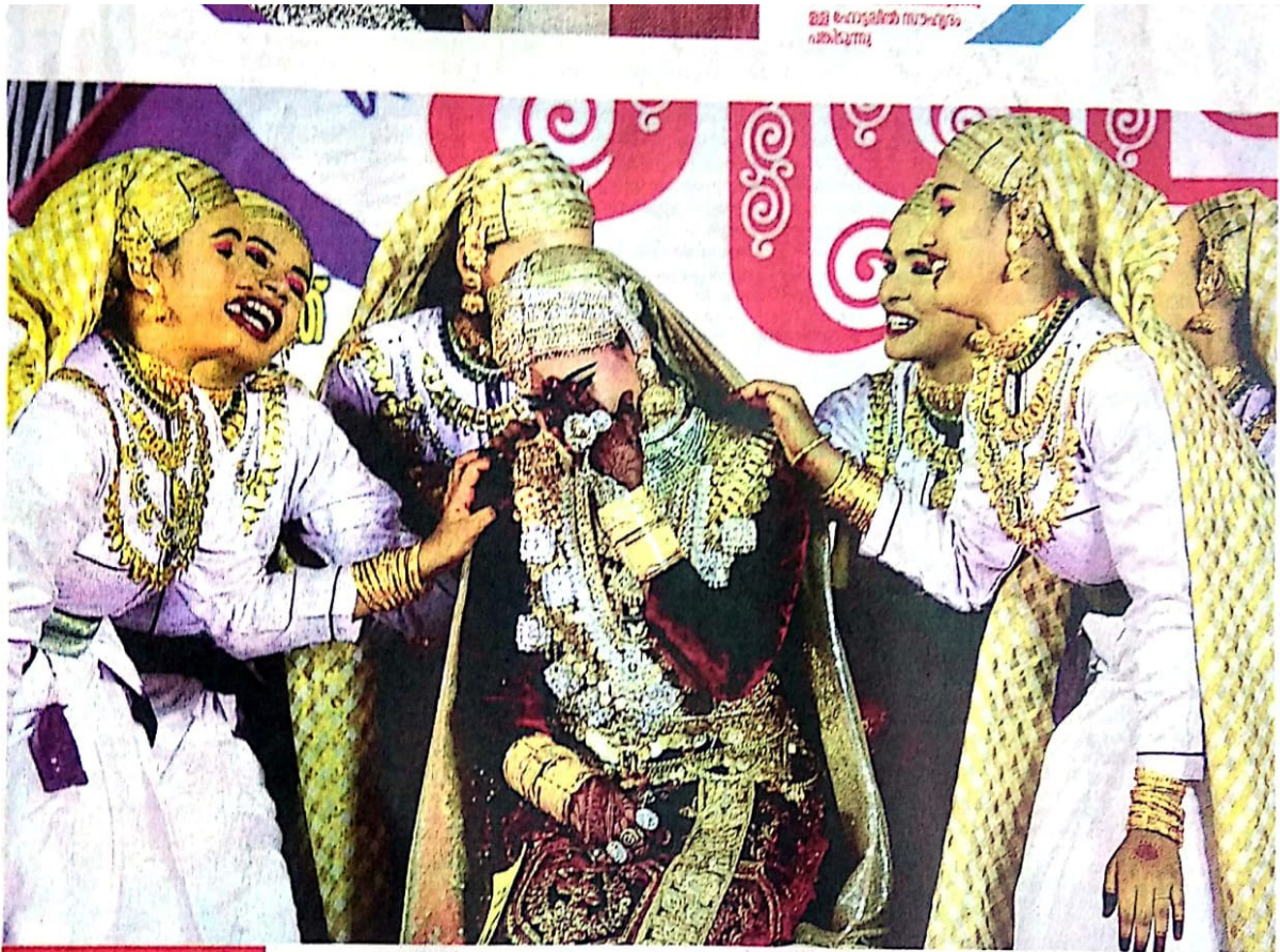
മമ്മി മഹാദേശ്വരിയുടെ സാഹസിക സാഹസികത