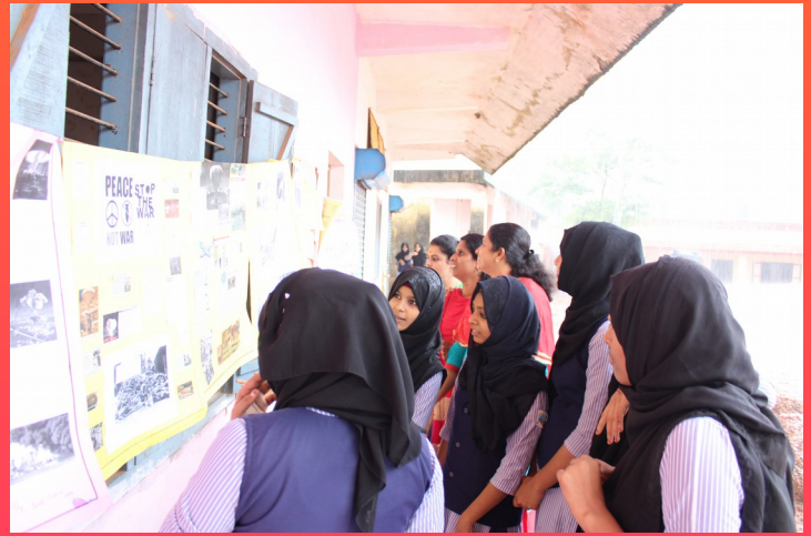
Anti war day