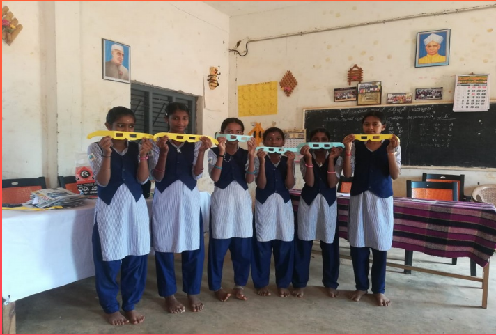
Sun glass making