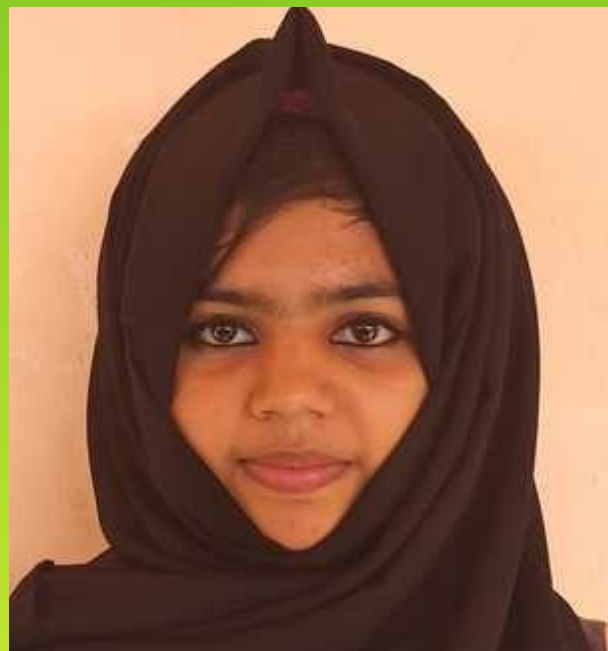
സഫ് അഷ്റഫ് പത്ത് എ

വീണ്ടുമൊരു പ്രഭാതത്തിന് ലോകം സാക്ഷിയായി. ആരോ പത്രവാർത്തവായിക്കുകയായിരുന്നു. 'കഞ്ചാവിനടിമയായ പ്ലസ് വൺ വിദ്യാർത്ഥി ആത്മഹത്യ ചെയ്ത നിലയിൽ കണ്ടു. ....'