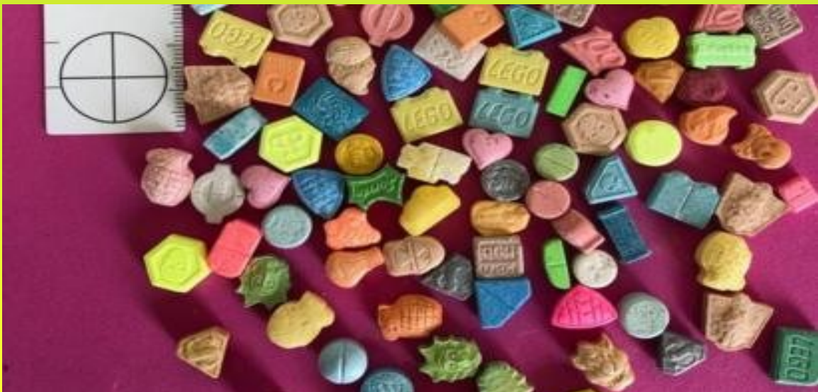
ജി എച്ച് എസ് കളിയാട്