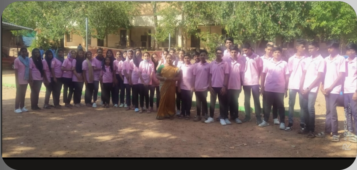
OUR LITTLE KITE TEAM 2023-2024