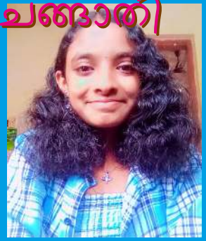
അനാമിക സന്തോഷ് 9D