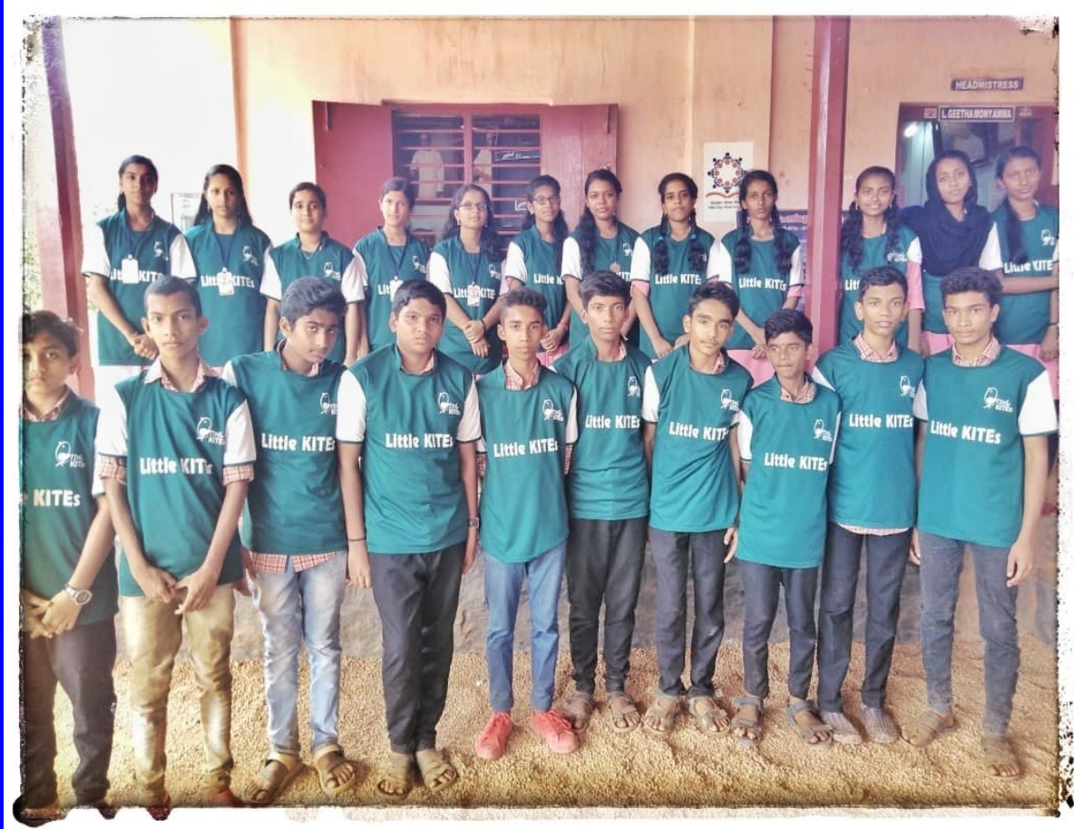
ലിറ്റിൽ കൈറ്റ്സ് അംഗങ്ങൾ