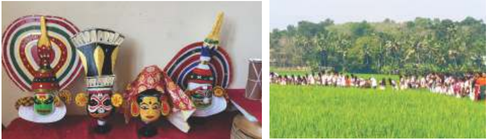
എൽ.പി. വിഭാഗം മലയാളം ELA പ്രോജക്ടിന്റെ ഭാഗമായി കുട്ടികൾ തയ്യാറാക്കിയ കലാരൂപങ്ങൾ