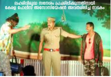
ലഹരിവിരുദ്ധ സന്ദേശം പ്രചരിപ്പിക്കുന്നതിനായി കേരള പോലീസ് അനുസരിച്ചു. അറിവിലൂടെ മരണം