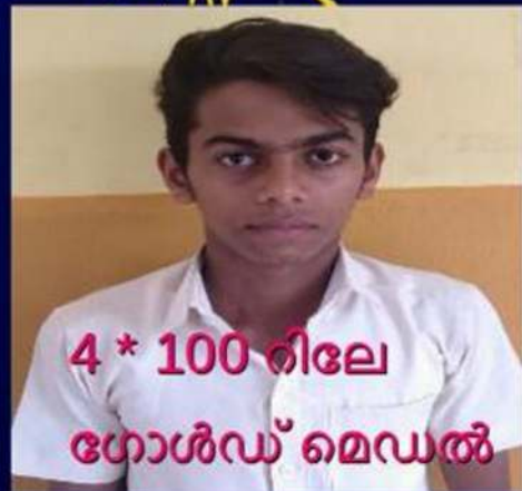
4 * 100 റിലേ ഗോൾഡ് മെഡൽ