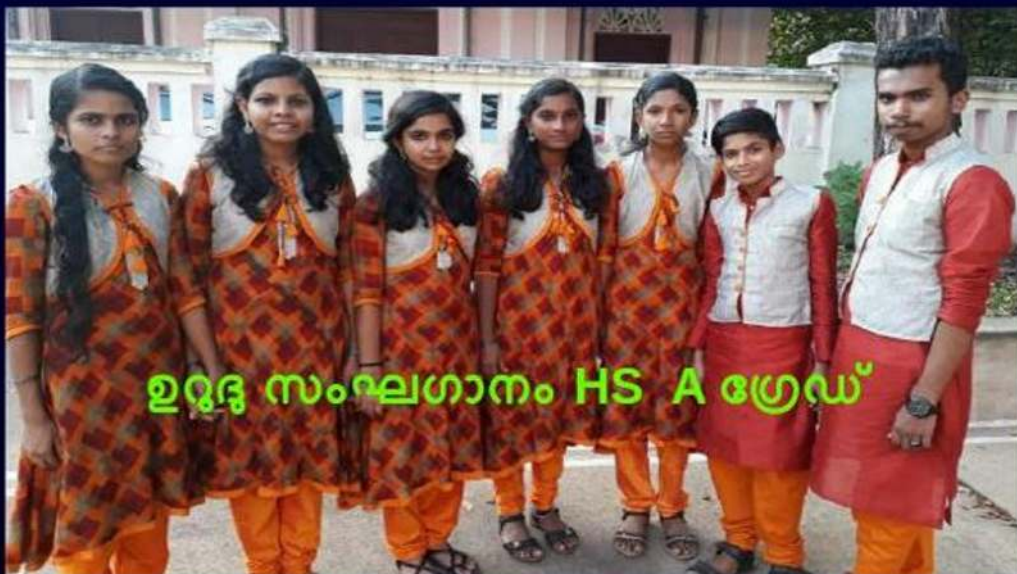
ഉദ്ദേശ സംഘടനം HS A ഗ്രേഡ്