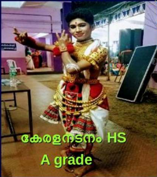
കേരളനടനം HS A grade