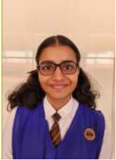
തീർത്ഥ ഇ കെ VIII A

സ്ത്രീ ശാക്തീകരണം എന്നത് നമുക്ക് എല്ലാം വളരെയേറെ പരിചിതമായ വാക്കാണ്. സമൂഹത്തിലെ പല വേദികളിലും നാം ഇത് കേൾക്കുന്നു. സ്ത്രീകൾ വേണ്ടത്ര ശക്തരല്ല ഇനിയും ശാക്തീകരിക്കപ്പെടേണ്ടതുണ്ട് .എന്നാണ് ഈ വാക്ക് സൂചിപ്പിക്കുന്നത്. സ്ത്രീകൾക്ക് ജോലി ചെയ്യുവാനും സമ്പാദിക്കാനും പുരുഷന്മാർക്ക് തുല്യമായ തീരുമാനങ്ങൾ എടുക്കുവാനും തുല്യ അവസരം നൽകുന്നതിലൂടെ സമൂഹത്തിൽ നിലനിൽക്കുന്ന ലിംഗ വ്യത്യാസം കുറയുന്നു.