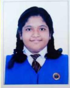
Hiranmayi A k VII A

Social media has become an integral part of our lives, influencing how we connect, communicate, and share information. While it brings several positive aspects, it also carries some negative effects, especially for children.