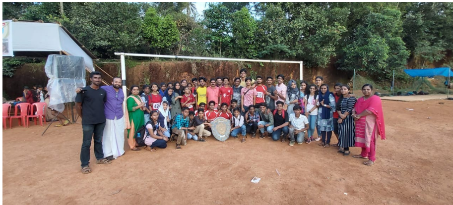
സബ്ജില്ല കായിക ജേതാക്കൾ