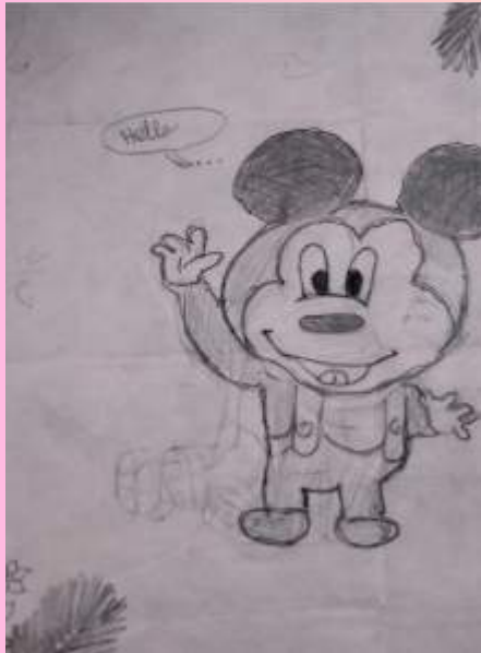
അസ്ന ഫാത്തിമ 5ബി