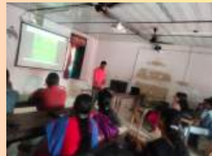
രക്ഷകർത്താക്കളുടെ ബോധവൽക്കരണ ക്ലാസ്