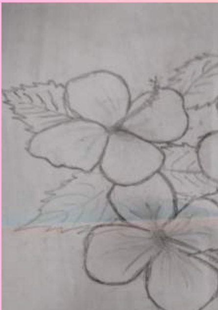
ഗൗതം കൃഷ്ണ 8 സി