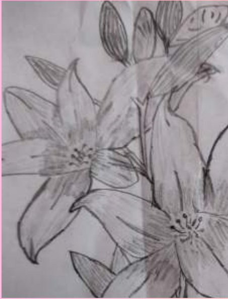
ആരോമൽ 8 C