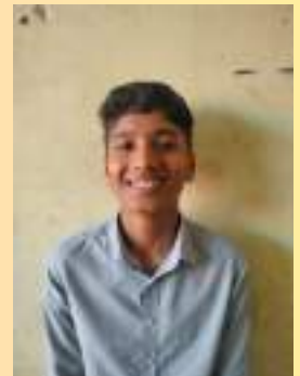
ജിൻസ് ജൈസ് സബ് എഡിറ്റർ