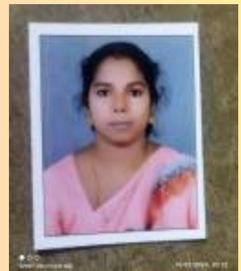
ദീപ എസ് ആർ ലിറ്റിൽ കൈറ്റ് മിസ്ട്രസ്