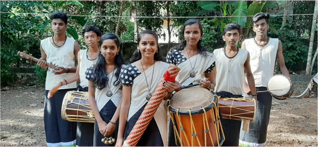
ഞങ്ങളുടെ നാടൻപാട്ട് സംഘം