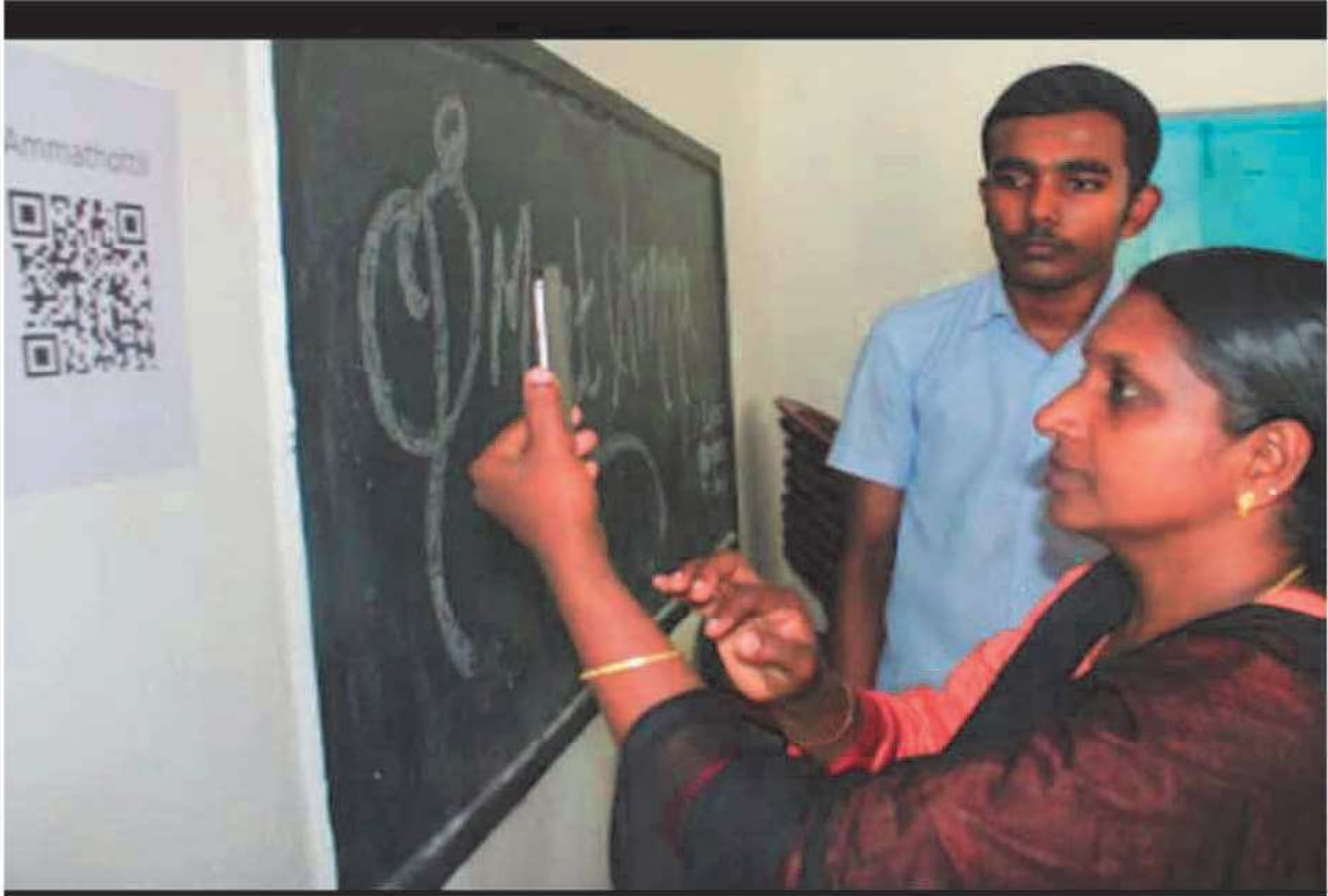
ലിറ്റിൽ കൈറ്റ്സിന്റെ ആഭിമുഖ്യത്തിൽ അമ്മമാർക്ക് വേണ്ടി നടത്തിയ 'സ്മാർട്ടമ്മ' സെമിനാറിൽ നിന്ന്.