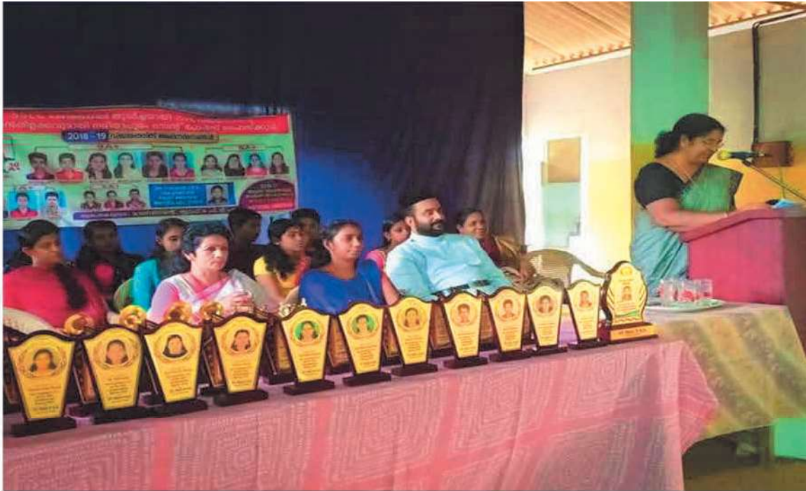
എസ്. എസ്. എൽ. സി. (2018-19) പരീക്ഷയിൽ ഉന്നത വിജയം നേടിയ വിദ്യാർത്ഥികളെ അഭിനന്ദിക്കുന്നു.