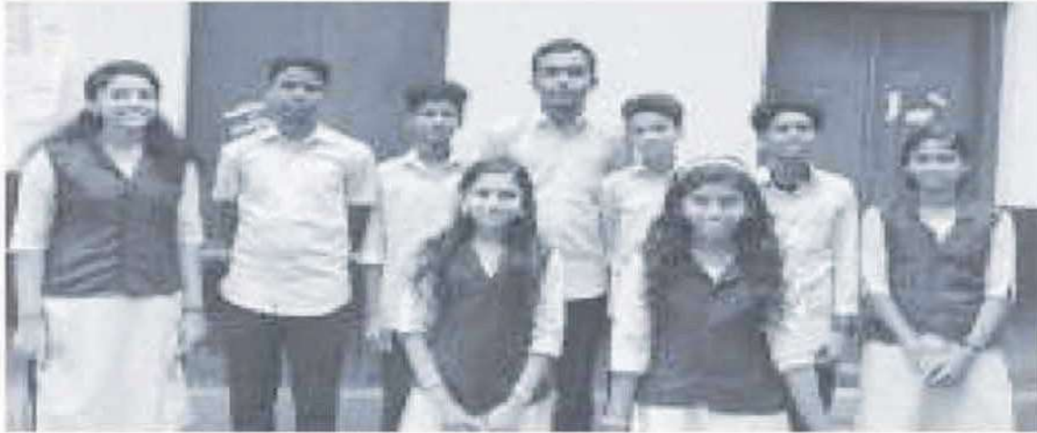
പന്ത്രണ്ടാം സബ്ജിക്റ്റിലും ഹൈസ്കൂൾ വിഭാഗം ഐ.ടി മേളയിൽ ഓവറോൾ കിരീടം നേടിയ നരിയാപുരം സെന്റ് പോൾസ് എച്ച് എസ്

വെയർ. വെബ് പേജ് ഡിസൈൻ, ഐടി ക്വിസ്, ഡിജിറ്റൽ പെയിന്റിംഗ് എന്നീ ഇനങ്ങളിലാണ് വിദ്യാർത്ഥികൾ മത്സരിച്ചത്.