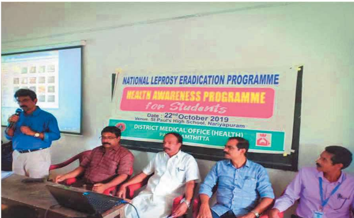
ദേശീയ കുഷ്ഠരോഗ നിവാരണയജ്ഞത്തിന്റെ ഭാഗമായി നടന്ന ബോധവൽക്കരണ ക്ലാസ്.