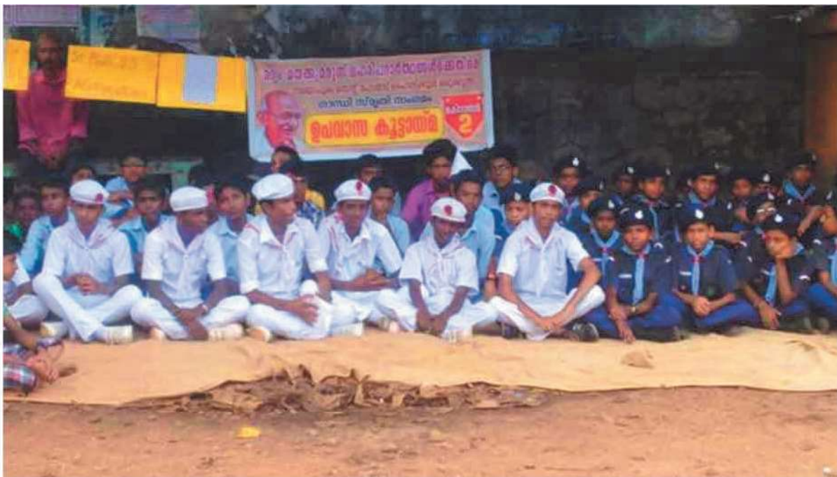
ലഹരി പദാർത്ഥങ്ങൾക്കെതിരെ ഗാന്ധിജിയെ അനുസ്മരിച്ച് നടത്തിയ ഉപവാസകൂട്ടായ്മ

പന്ത്രണ്ടാം സബ്ജിക്റ്റിലും ഹൈസ്കൂൾ വിഭാഗം ഐ.ടി. മേളയിൽ ഓവർ ഓൾ കിരീടം നേടിയ നരിയാപുരം സെന്റ് പോൾസ് ടീം.