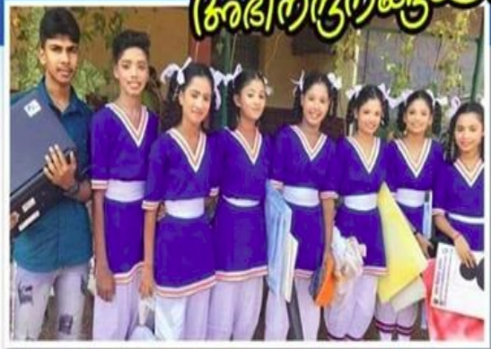
HS വിഭാഗം സ്കിറ്റ് ഇംഗ്ലീഷ്