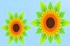
HS വിഭാഗം മാപ്പിളപ്പാട്ട്