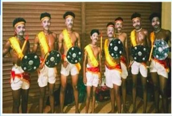
HS വിഭാഗം പരിചമുട്ട്