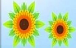
HS വിഭാഗം പദ്യംചൊല്ലൽ (ഉറുദു)