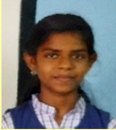
ഐറിൻ മരിയ -8

കൃഷിക്കാരൻ ചെടികൾ നോക്കാനായി വന്നു ആദ്യം അദ്ദേഹം പോയത് മാവ് പാടിയിരിക്കുന്നു കൊമ്പുകളും ഇലകളും എല്ലാം നശിച്ചു കൃഷിക്കാരനോട് ചോദിച്ചു നീ എന്തുകൊണ്ടാണ് വാടി പോയത് നിനക്ക് ഞാൻ ആവശ്യത്തിലധികം ജലം നൽകിയത് അല്ലേ അപ്പോൾ മാപ്പ് പറഞ്ഞു എനിക്ക് ഒരു കൂട്ടുകാരനെ കിട്ടി പക്ഷെ അവൻ എന്റെ ആത്മാർത്ഥ സുഹൃത്ത് ആണെന്ന് ഞാൻ വിചാരിച്ചു എന്നാൽ അവൻ സ്നേഹം നടിച്ചു എന്നെ ചതിച്ചു അവന്റെ പേര് ഇത്തിൽകണ്ണി കൃഷിക്കാരൻ പേര് നോക്കാൻ നന്നായി പോയി പേര് നന്നായി നിൽക്കുന്നു കൃഷിക്കാരൻ പേര് യോട് ചോദിച്ചു മാവ് നശിച്ചു എന്നിട്ടും നീ എന്താണ് ഇങ്ങനെ ഫലഭൂയിഷ്ടമായ നിൽക്കുന്നത് അതിന്റെ രഹസ്യം എന്താണ് പേര് പറഞ്ഞു എനിക്ക് ഒരു കൂട്ടുകാരനെ കിട്ടി പക്ഷെ അവന്റെ ദേഹം നിറയെ ആളുകളായിരുന്നു ജലപ്രളയത്തിൽ അവൻ എന്നെ താങ്ങി നിർത്തി മുള ആണെങ്കിലും അവൻ എന്നെ ചേർത്തു നിർത്തി എനിക്ക് മുളകൾ കൊണ്ട് വേദന എടുത്തു എങ്കിലും അവൻ എന്നെ അവന്റെ പേര് കള്ളിമുൾച്ചെടി ഇതിൽ നിന്നും നാം മനസ്സിലാക്കേണ്ടത് കൂട്ടുകാരനെ തിരഞ്ഞെടുക്കുമ്പോൾ നല്ല കൂട്ടുകാരനെ വേണം തിരഞ്ഞെടുക്കാൻ