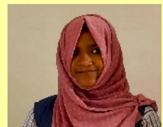
അസ്സ കെ ആർ