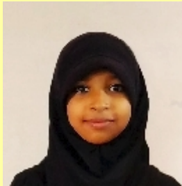
ഹൈന ഫാത്തിമ - 6

ഒരിക്കൽ ഒരു ഗ്രാമത്തിൽ ഒരു കൊച്ചു വീട് ഉണ്ടായിരുന്നു ആ വീട്ടിൽ അമ്മയും ഒരു മകനും മാത്രമേ ഉണ്ടായിരുന്നുള്ളൂ അവരുടെ അച്ഛൻ ഒരു വർഷം മുമ്പ് മരണപ്പെട്ടു. ജോലിക്ക് പോകാൻ ഭയങ്കര മടി ആയിരുന്നു. ജോലി ചെയ്ത ആ മകന് ആവശ്യമായ സാധനങ്ങൾ വാങ്ങി കൊടുത്തു. ഒരു സന്യാസിയെ കണ്ടു എന്നിട്ടും മടിയെ കുറിച്ച് പറഞ്ഞു അപ്പോൾ സന്യാസി പറഞ്ഞു മടി മാറ്റാൻ ഉള്ള വഴി ഞാൻ പറഞ്ഞുതരാം. ഒരു വടിയെടുത്തു എന്നിട്ട് പറഞ്ഞു ഒരു ശക്തിയുണ്ട് എന്ന് പറഞ്ഞു വിട്ടു എന്ന് പറയുമ്പോൾ അത് അടിച്ചു പറഞ്ഞു വീണ്ടും ഈ വടി നിൻറെ വീടിൻറെ മുകളിൽ വയ്ക്കണം ഈ വടിയുടെ രഹസ്യം മകനോട് പറയരുത്. അങ്ങനെ അമ്മ വടിയുമായി വീട്ടിൽ പോയി. അന്നുമുതൽ മകനെ അടിച്ചു ജോലിക്ക് വിടാൻ തുടങ്ങി. അമ്മ അടിച്ചതിനാൽ എന്നും ജോലിക്ക് പോയി ഇപ്പോൾ മടി പോയി അമ്മ ഒരുപാട് സന്തോഷിച്ചു സന്യാസിയോട് നന്ദി പറഞ്ഞു.