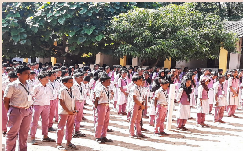
The Bards of Tech