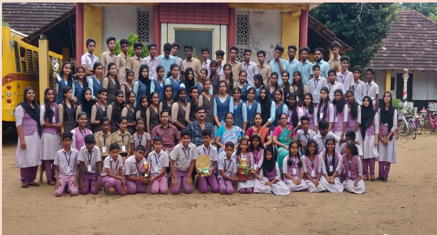
The Bards of Tech