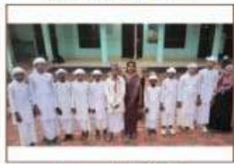
Vattappattu A GRADE