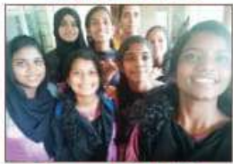
Group song Urdu II A GRADE