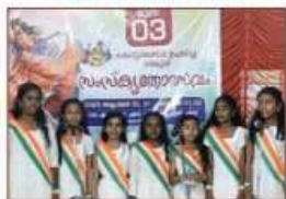
Vande Matharam A GRADE