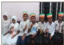
Sangha gaanam A GRADE