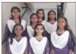
Sangha gaanam ഏറ്റവും നല്ലത്