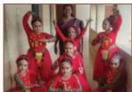
Sangha Nrutham III A GRADE