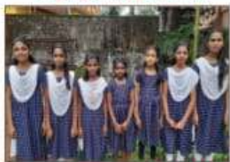
Deshabhakthi gaanam II A GRADE