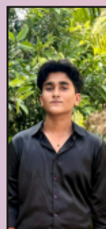
9/12 FADIY 10 J

It was when we set foot back on school grounds , we realised that two third of our school life was over and the rest will be filled with exams and rest . We will forever remember the sweet moments the tour by our school gifted us . We will Cherish it in our hearts as we are about to set out on our alternate paths.