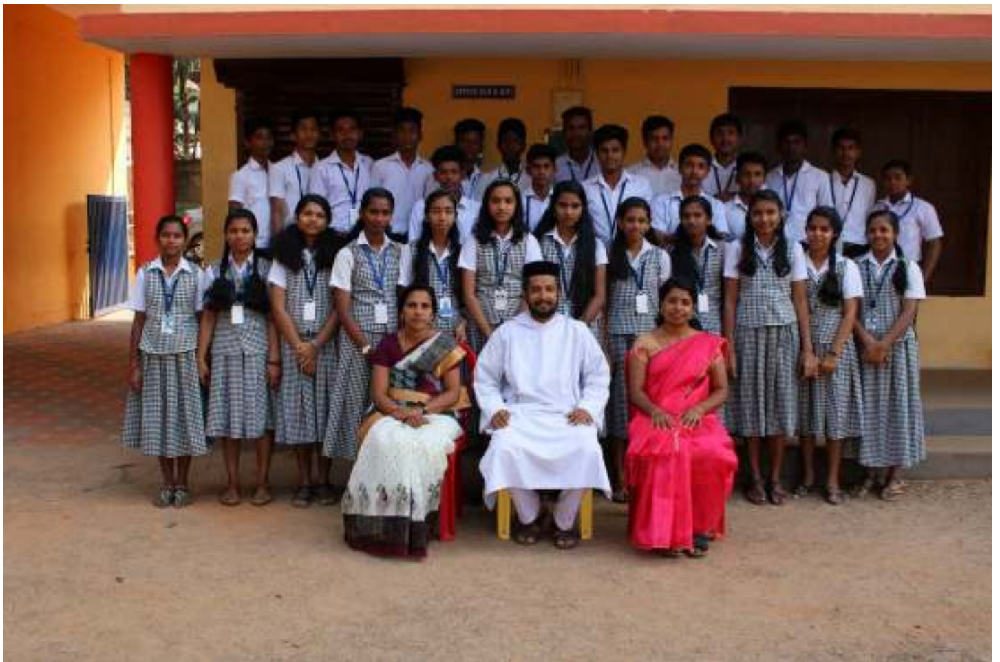
Our Kites Team