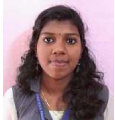
സൂര്യ പ്രസാദ് XII കൊമേഴ്സ്