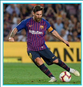
സോബി കെ എഫ് 9C

സ്വന്തം കഴിവ് പെട്ടെന്ന് തിരിച്ചറിയുകയും അതിനെ വളർത്തുകയും ചെയ്തുകൊടുക്കുക. കുട്ടിയുടെ കളികളാണ് ബാർസലോണ ടീമിന്റെ കോച്ച് കുട്ടിയെ കൊണ്ട് കരാർ ഒപ്പിടിയിപ്പിക്കുകയും ചെയ്തു. തന്റെ വൈകല്യം തിരിച്ചറിയുകയും മാതാപിതാക്കൾ അവന്റെ വളർച്ചയ്ക്കായി കാശ് മുടക്കുകയും തന്റെ പിതാവിന്റെ വരുമാനം ചികിത്സക്ക് തികയാത്തതു കൊണ്ട് കുട്ടിയുടെ ചികിത്സ സഹായം ക്ലബ്ബുകാർ ഏറ്റെടുത്തു. കുട്ടി സ്റ്റാനിഷിലേക്ക് മാറണമെന്നു പറഞ്ഞു. കുട്ടി സ്വന്തം രാജ്യത്തിനുവേണ്ടി മാത്രമേ കളിക്കുകയുള്ളുവെന്നും പറഞ്ഞു. അതു കാരണം കുട്ടിക്ക് സ്റ്റാനിഷിലും അർജന്റീനയിലും അംഗത്വം എടുക്കുകയും ചെയ്തു. തന്റെ കളിയിൽ ഗോൾ അടിക്കുന്നുണ്ടെങ്കിൽ ആദ്യം ദൈവത്തിന് നന്ദി പറയുകയാണ് ചെയ്യുക എന്നും ആ കുട്ടി പറഞ്ഞു-ആരാണ് ഈ കുട്ടി- നിങ്ങൾക്കറിയാമോ?