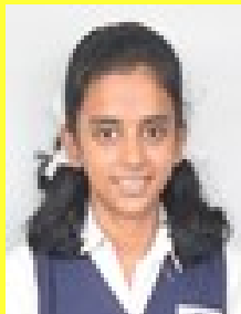
ഹെലൻ വി.എ സംസ്ഥാന പ്രവൃത്തിപരിചയ മേള [ചോക്ക് നിർമ്മാണം, എ ഗ്രേഡ്]