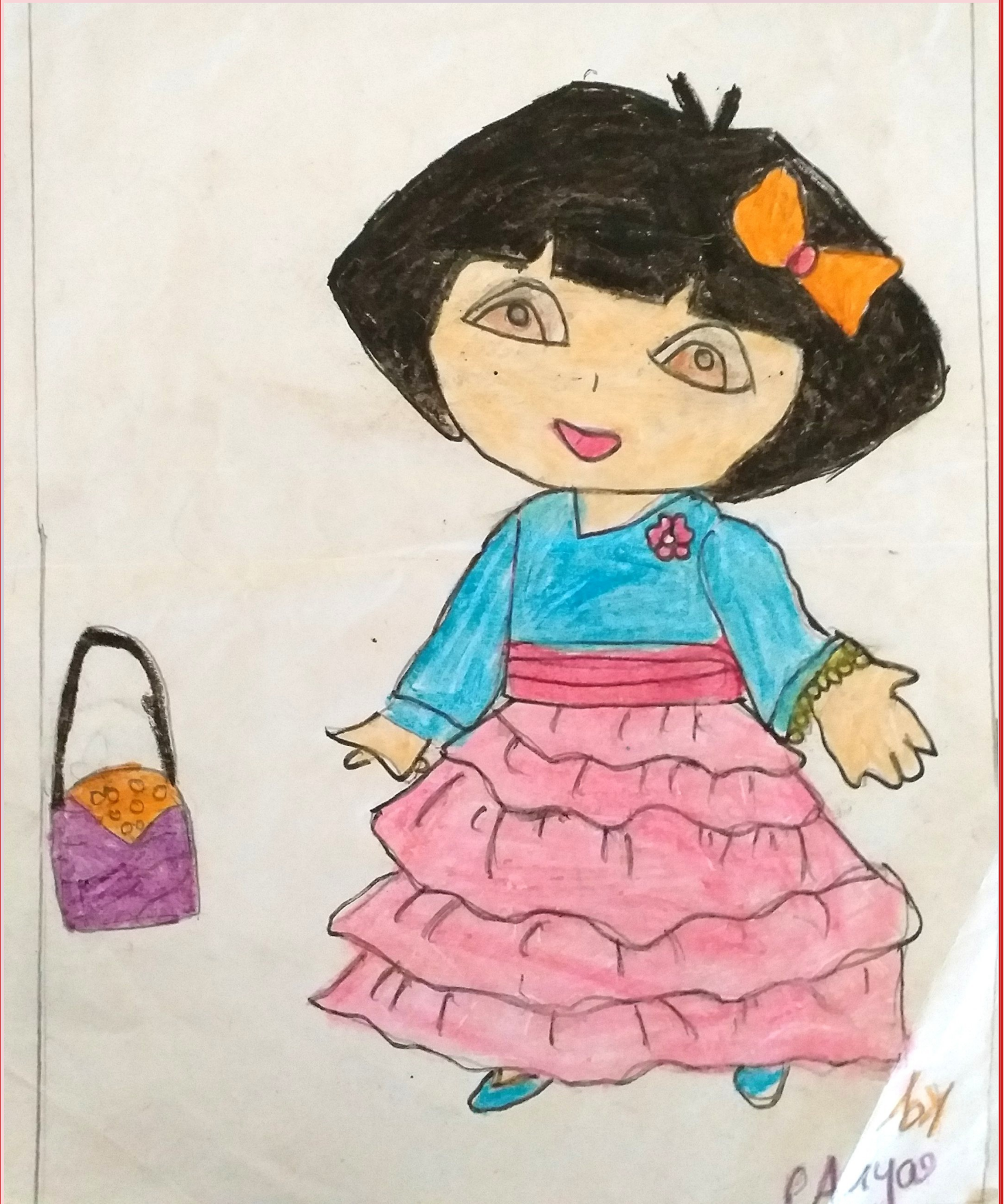
Aryanandha , VA