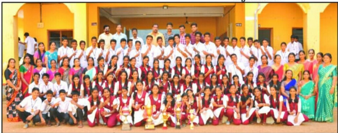
വെണ്ടാർ ശ്രീവിദ്യാധിരാജാ ഹയർ സെക്കന്ററി സ്കൂളിലെ വിദ്യാർത്ഥികൾ അധ്യാപകരോടൊപ്പം