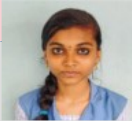
സാര .ജെ .എസ് ,9.എ

ജാലകമെല്ലാമടക്കം കിനാവിന്റെ കാറ്റനങ്ങാത്ത മനസ്സിന്റെ ജാലകം ഉച്ചയുറക്ക ചടവുമായി ഞാൻ എന്റെ വിശ്വാസത്തിന്റെ വെയിൽപ്പാത താണുവേ ദൂരനിന്നേതുവിലാപം നിരത്തിനുംഭ്രാന്ത് പുലമ്പുമമ്മക്ക മെത്ര കാതം നിരത്തിനുംചേലയുറിയും വിശപ്പിനമിടയ്ക്കത്രദൂരം മരങ്ങളിലാരം തിരുമുറിവേൽക്കുന്നു മൃതിയുടെപോക്കിളിയിൽകത്രികപ്പടായ് മരങ്ങൾമുറിയുന്നു പുത്തൊരവെല്ലാം നറുങ്ങി കൊന്നക്കയ്ക്ക് കിഴെ ചിതറുന്നു സൗവർണ്ണസ്വപ്നങ്ങൾ ഒക്കെയുമോർമകൾമാത്രം ഗതകാലസ്വപ്നങ്ങൾതൻ സ്റ്റീഫ്ദചിത്രങ്ങൾമാത്രം, നമ്മുക്കുതിമണ്ണമാത്രം മുളക്കാത്ത കുഴികളും കാർമ്മേല വന്ധ്യമാനന്തമാം ആകാശസീമയുമാത്രം