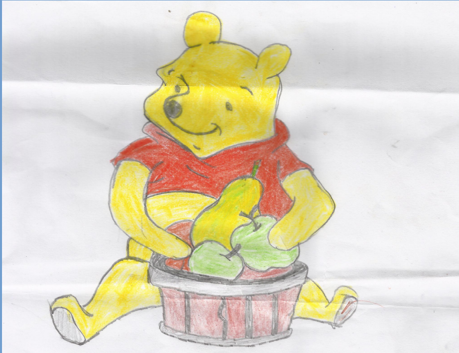
ചന്ദന .ബി ,9.A