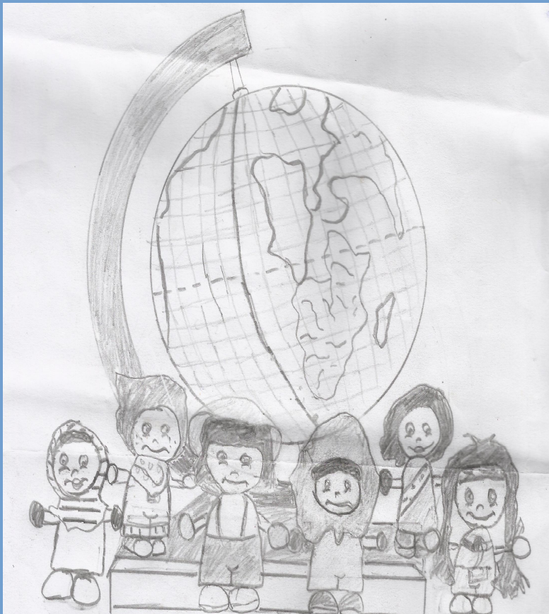
വൈഷ്ണവി .എസ് .9.എ