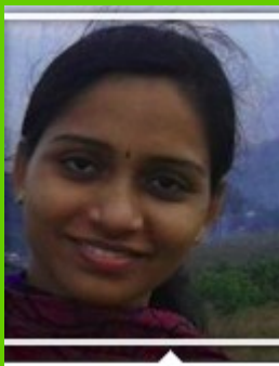
ലിറ്റിൽകൈറ്റ്സ് ഡിജിറ്റൽ മാഗസിൻ

യാഥാർഥ്യമാക്കാൻ സഹായിച്ച ലിറ്റിൽകൈറ്റ്സ് അംഗങ്ങൾക്ക് നന്ദി.