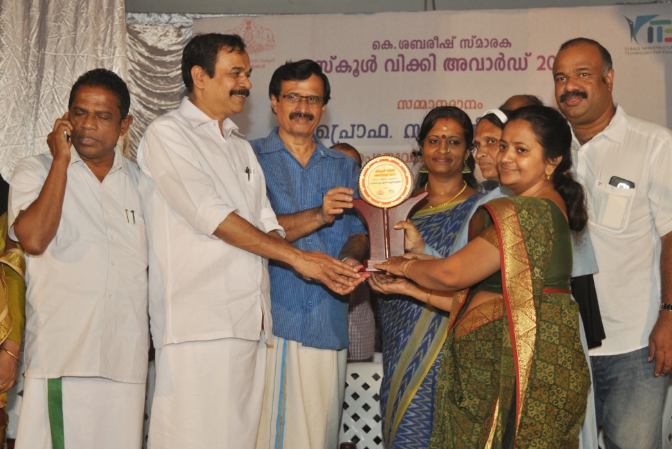
സ്കൂൾ വികസി അവാർഡ്