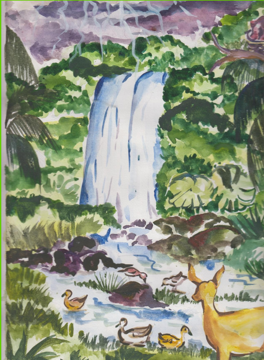
ജൈവവൈവിധ്യം നാടിനെ നന്മപൂർണ്ണമാക്കുന്നു