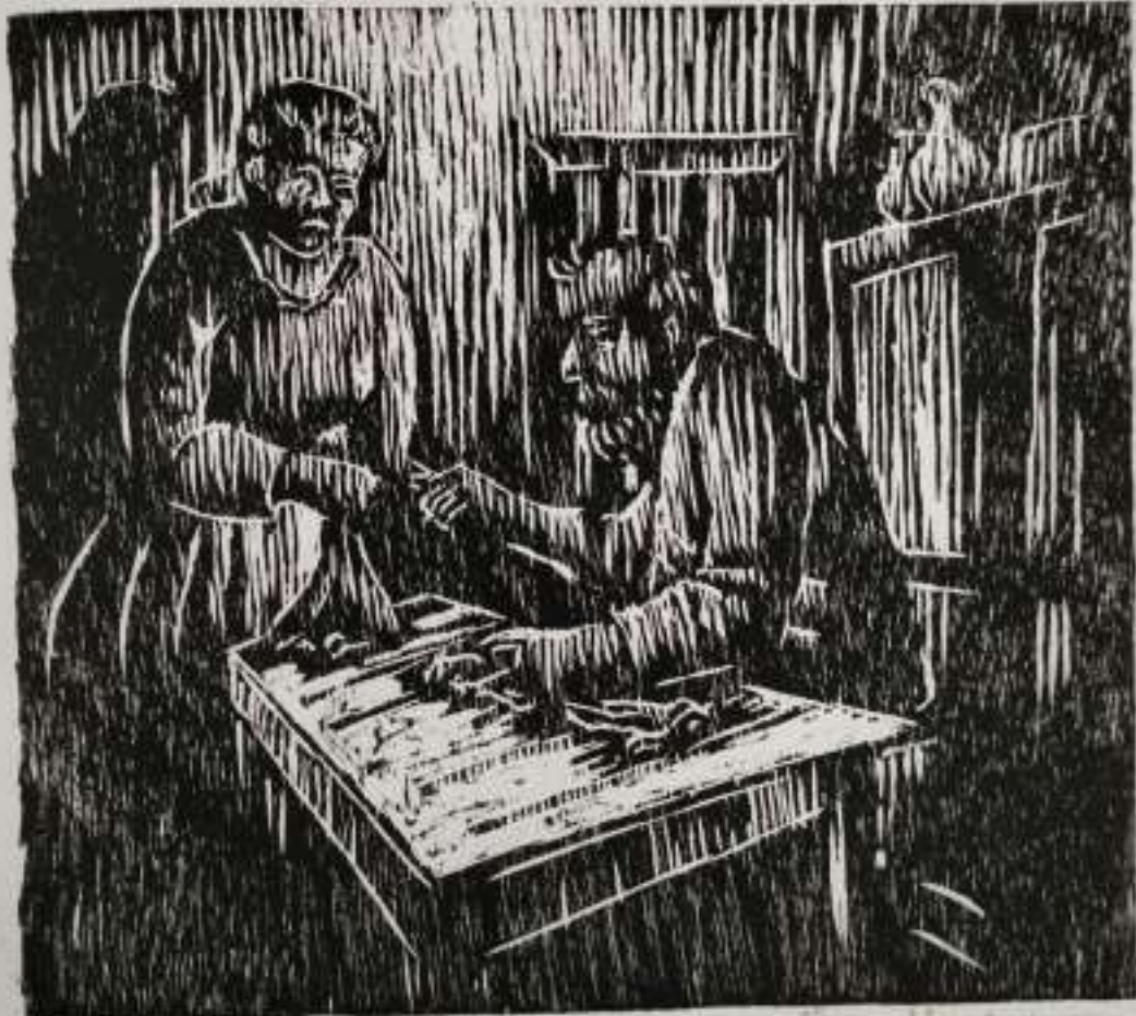
AP 33 Woodcut