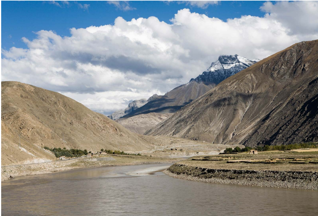
ലിറ്റിൽ കൈറ്റ്സ് ഡിജിറ്റൽ മാഗസിൻ

ഇന്ത്യൻ കാർഷികമേഖലയുടെ നട്ടെല്ല് എന്നറിയപ്പെടുന്ന ഉത്തരേന്ത്യൻ സമതലങ്ങൾ ലോകത്തെ വിസ്തൃതമായ എക്കൽ സമതലങ്ങളിലൊന്നാണ്. സിന്ധുസമതലം, ഗംഗാസമതലം, ബ്രഹ്മപുത്രാ സമതലം, എന്നിങ്ങനെ മൂന്നു ഭാഗങ്ങളായി കാണപ്പെടുന്ന ഈ സമതലപ്രദേശത്തിന്റെ ഏറ്റവും വിസ്തൃതമായ ഭാഗം ഗംഗാസമതലമാണ് ഗോതമ്പ് ചോളം പയർവർഗങ്ങൾ കരിമ്പ് ചണം മുതലായ വിളകൾ ഇവിടെ കൃഷിചെയ്യുന്നു. ഇന്ത്യയുടെ ജനസംഖ്യയുടെ നല്ലൊരു പങ്ക് അധിവസിക്കുന്ന ഈ പ്രദേശം ഉത്തരേന്ത്യൻ നദികളുടെ നിക്ഷേപണ ഭൂ പ്രദേശമാണ്.