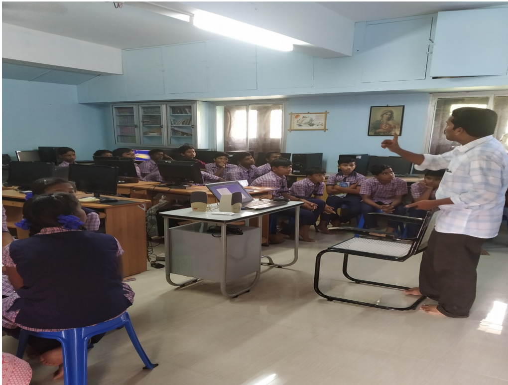
ലിറ്റിൽ കൈറ്റ്സ് ഡിജിറ്റൽ മാഗസിൻ

ഇനി പൊയ്ക്കൊള്ളൂ. ഇന്നത്തെ അധ്യയനം കഴിഞ്ഞു.