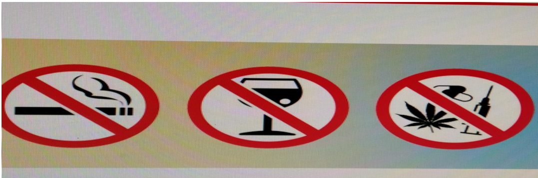
ലിറ്റിൽ കൈറ്റ്സ് ഡിജിറ്റൽ മാഗസിൻ

മദ്യത്തിന്റെയും മയക്കുമരുന്നിന്റെയും വിപത്തുകളെപ്പറ്റി എല്ലാവർക്കും അറിയാമല്ലോ ഒരിക്കലും ഈ ആപത്തിൽ പെട്ടുപോകരുതെ ശരിയല്ലാത്ത കൂട്ടുകെട്ടും ദുശ്ശീലങ്ങൾ വളർത്തുന്ന സാഹചര്യവും ഒഴിവാക്കണം. മദ്യവും മയക്കുമരുന്നും നിങ്ങളിലെ യഥാർത്ഥകതിത്വത്തെ ഇല്ലാതാക്കും.കഴിവുകളെ നശിപ്പിക്കും. സ്നേഹബന്ധങ്ങളെ സാമൂഹികബന്ധങ്ങളും ഇല്ലാതാക്കും. മാതാപിതാക്കളെയും ഉറ്റമിത്രങ്ങളെയും വെറുപ്പിക്കും സമൂഹം അകറ്റി നിർത്തുന്ന ഒരാൾക്ക് നാടിനുവേണ്ടി ഒന്നും ചെയ്യാനാവുകയില്ല മയക്കുമരുന്നിനെതിരെയുള്ള പ്രവർത്തനത്തിന് നാം മുന്നിട്ടിറങ്ങണം ചുറ്റുമുള്ള ആരെങ്കിലും തെറ്റായ വഴിയിൽ സഞ്ചരിക്കുന്നുവെന്ന് അറിഞ്ഞാൽ ആ വിവരം അധ്യാപകരോട് പറയാൻ മടിക്കരുത്