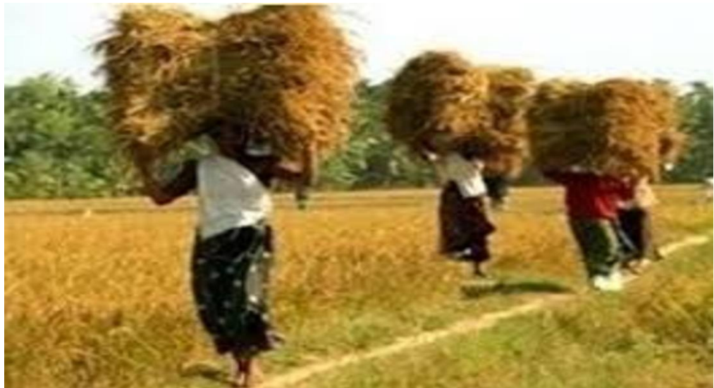
ലിറ്റിൽ കൈറ്റ്സ് ഡിജിറ്റൽ മാഗസിൻ

"മാരി മഴകൾ ചൊരിഞ്ഞ്- ചെറു വയലുകളൊക്കെ നനഞ്ഞ് പൂട്ടിയൊരുക്കിക്കഴിഞ്ഞ്. ഓമല ചെന്തില മാല - ചെറു കണ്ണമ്മ കാളി കറമ്പി ചാത്ത ചടയിമാരായ ചെറു മച്ചികളെല്ലാവരും വന്തേ"