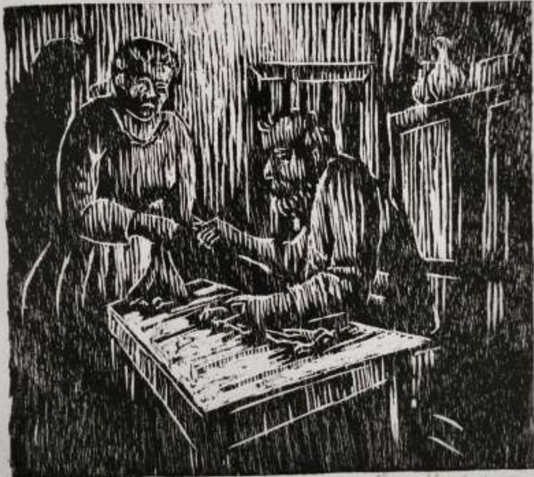
AP 33 Woodcut