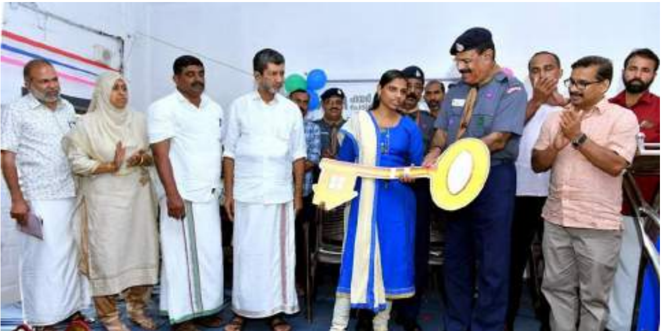
NAM സ്കൂളിന്റെ സഹപാഠിക്കാരുടെ കൈത്താങ്ങി