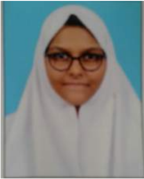
ഫാത്തിമ.എൻ തമിഴ് കവിതാരചന