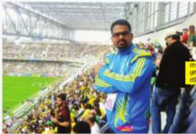
നാക്കാർ ശ്രദ്ധയിലെ നിറുവിയത്തിൽ

യ നക്ഷത്രങ്ങൾ പിറവിയെടുക്കുന്നതും പഴയവ വിന്നുടുക്കുന്നതും കണ്ടിറിയെ കണക്കാത് സാധിച്ചതിന് പുറമെ ഫുട്ബോൾ ഇതിഹാസമായിരുന്ന വികസന മറഡോണയെ അടുത്തുനിന്ന് കണക്കാത് കഴിഞ്ഞതും വലിയ ഭാഗ്യമായിരുന്നു. അർജന്റീന യിൽനിന്നു കോപ്പായിരുന്ന അദ്ദേഹത്തിന്റെ സ്മരണയെത്തിയ കരത്തക്കത്തു വരവ് തന്നെ ആവേശകരമായിരുന്നു. കറുത്ത സ്യൂട്ടിനീഞ്ഞ് ഗ്രാസിൽ ഹിന്റർപ്ലെയർ പുറത്ത് നിൽക്കുന്നപ്പോൾ കാനികളെ അലിവാറ്റും പെന്റാസ്കോൾ സ്മരണയെത്തിയതുകൊണ്ട് ഒരു മനോഹര ഗോൾ പിറന്നതിന്റെ ഹൃദയം കേൾക്കാം. ഇന്നും കാൽബിൽ മുഴങ്ങുന്ന ഗായിക ക്ലബിന്റയുടെ 'വക്കോവക്കോ'യും മറക്കാനാവില്ല. ലോകകപ്പിന് പ്രചാരം നേടിക്കൊടുക്കുന്നതിൽ ഈ ആദ്ധ്യക്ഷാനം വഹിച്ച പങ്ക് നിസ്തർക്കമായിരുന്നു.