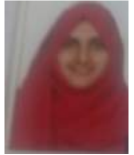
ജയിദ ജഷ്ന X-N